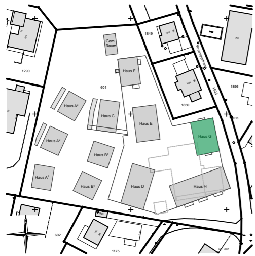
Situationsplan Mst. 1:2000

Möbelierung im Kaufpreis nicht enthalten